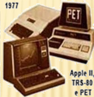
Apple II, TRS-80 e PET