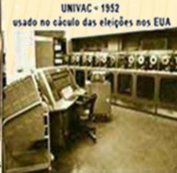
UNIVAC - 1952 usado no cálculo das eleições nos EUA