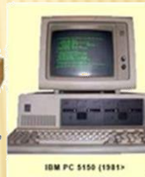
IBM PC 5150 (1981)