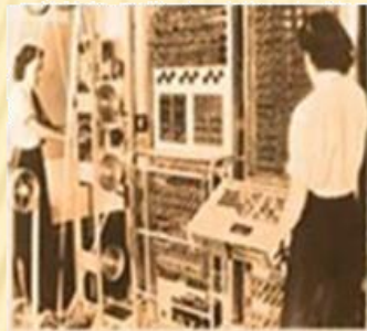
COLOSSUS - 1943 Serviu a quebrar códigos secretos alemães